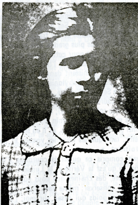
LESYA UKRAINKA 1871-1913